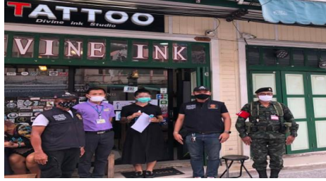
ภาพที่ 8 การตรวจติดตามผลของสถานประกอบการภายใต้มาตรการที่กรุงเทพมหานครกำหนด

ที่มา. จาก กระบวนการจัดการโควิด - 19 , โดย สำนักงานเขตพระนคร กรุงเทพมหานคร, 2563, ค้นเมื่อ 1 กรกฎาคม 2563, จาก https://web.facebook.com/pranakorn