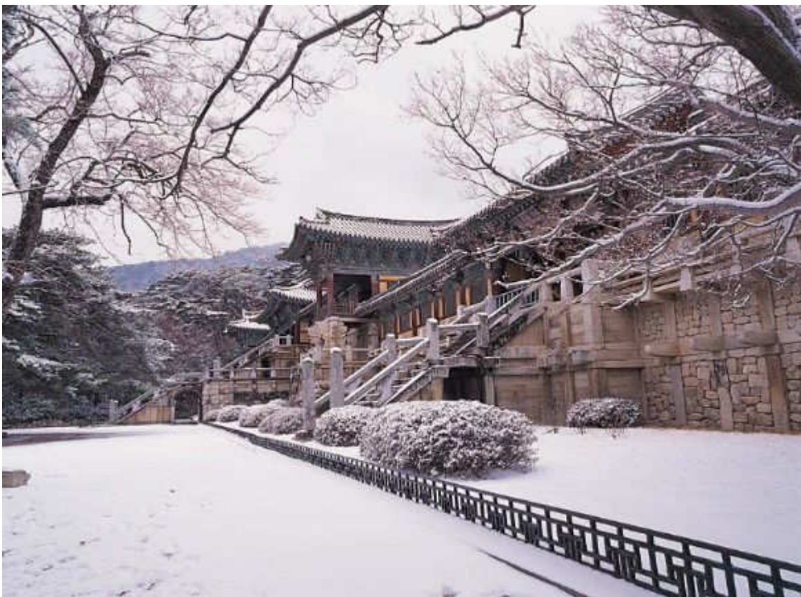
วัดพุทธก๊วกซา เมืองเคียงจู เกาหลีใต้