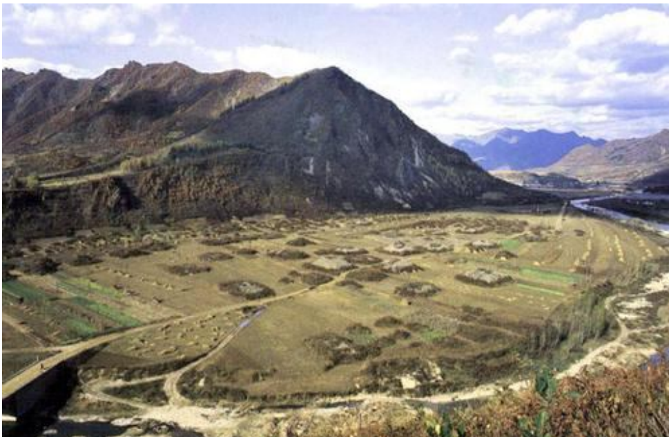
Capital Cities and Tombs of the Ancient Koguryo Kingdom