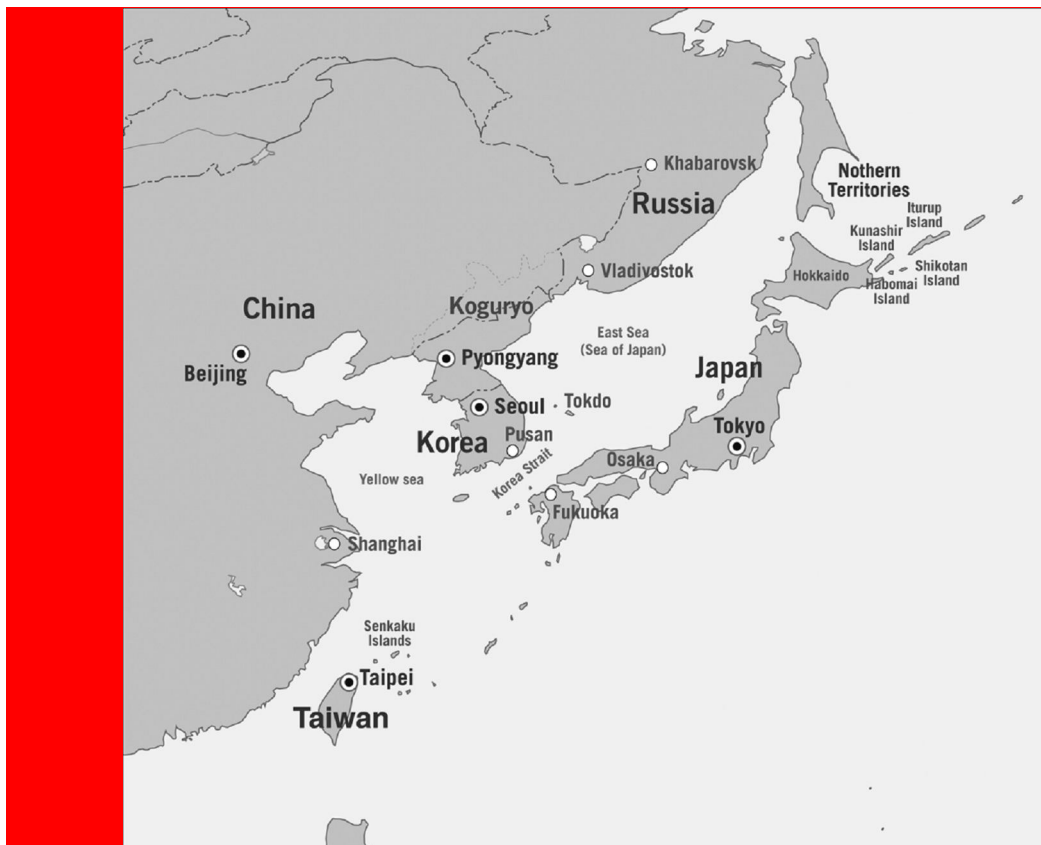
แผนที่แสดงอาณาจักร โคกูริว

ผู้เขียน รองศาสตราจารย์ ดร. ดำรงค์ ฐานดี ศูนย์เกาหลีศึกษา มหาวิทยาลัยรามคำแหง ตุลาคม 2552