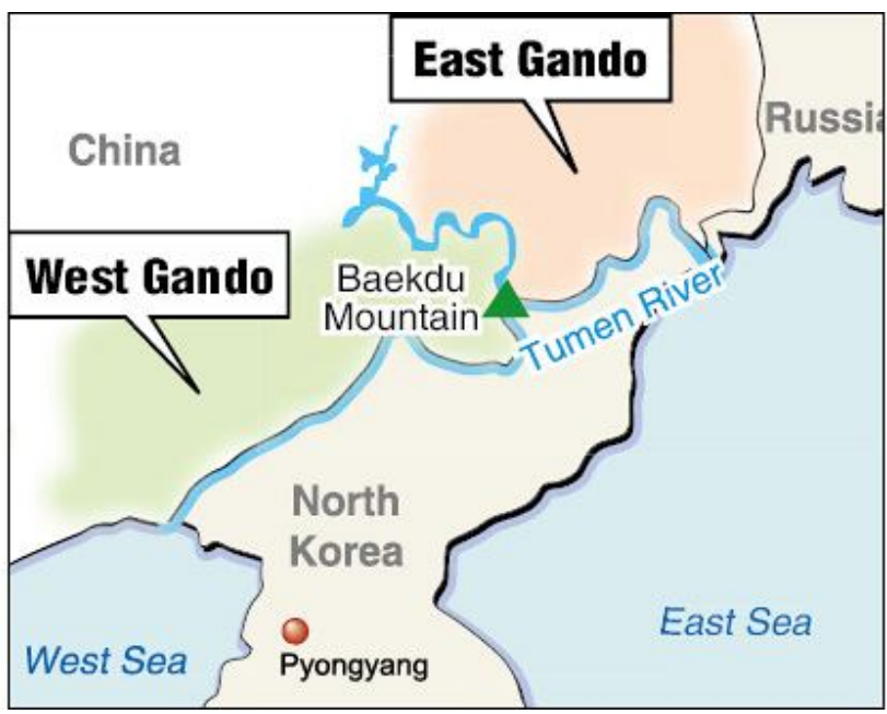
แผนที่แสดงบริเวณเขตกันโด

เหตุการณ์ที่ 2 ในเดือนสิงหาคม ค.ศ. 2009 สมาชิก คณะกรรมาธิการกิจการต่างประเทศ และการค้าของเกาหลีใต้จำนวน 50 คนได้ยื่นญัตติต่อรัฐสภาเรื่องการอ้างสิทธิ์เหนือดินแดนบริเวณกันโดว่า เป็นดินแดนของอาณาจักรโคกูริวของเกาหลี ต่อมาในเดือนกันยายน สกเดียวกัน องค์กรเอกชน 10 กลุ่มได้ยื่นเรื่องไปยังศาลโลก (International Court of Justice) เพื่อให้ยอมรับว่า บริเวณกันโด ซึ่งอยู่ทางภาคตะวันออกเฉียงเหนือของจีนปัจจุบันเป็นส่วนหนึ่งของดินแดนเกาหลี